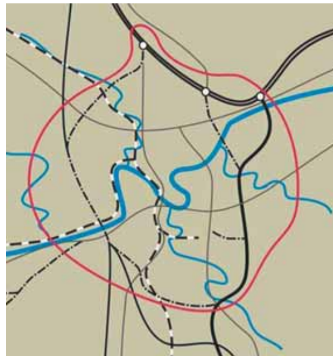
Skica iz Občinskega prostorskega načrta z možnostjo za priključitev tretje razvojne osi pri Lešnici (debelejša črna črta od avtoceste v zgornjem delu proti spodnjem delu skice. Železnica je narisana z belo-črno črto, vodotoki pa z modro. (Acer d.o.o.)