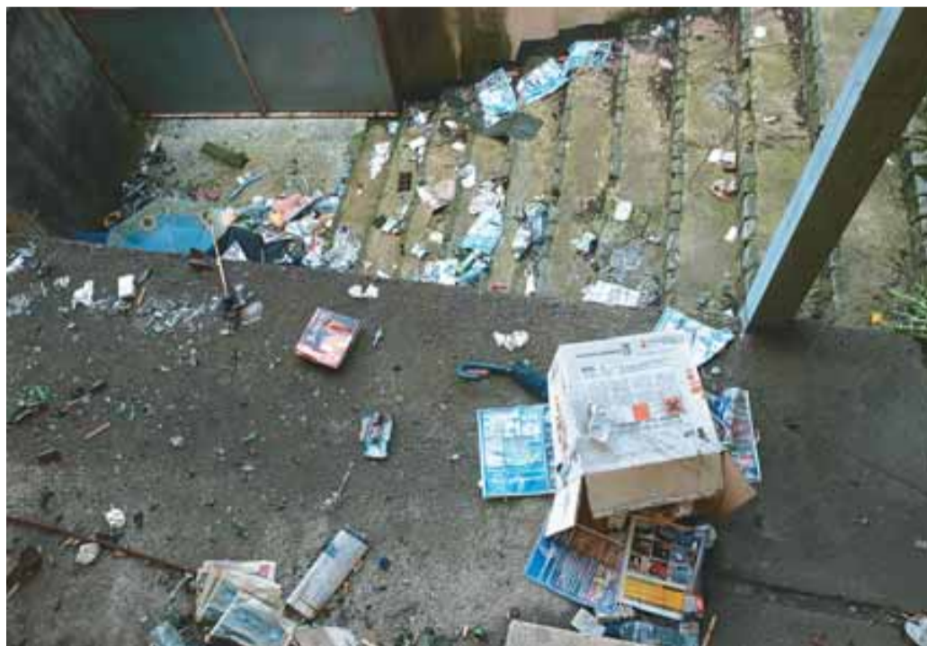
Ena od črnih točk onesnaženosti je prav gotovo novomeška avtobusna postaja, ki je tudi sicer eden najmanj uglednih objektov v mestu. Tukaj bodo imeli prostovoljci zanesljivo dovolj dela