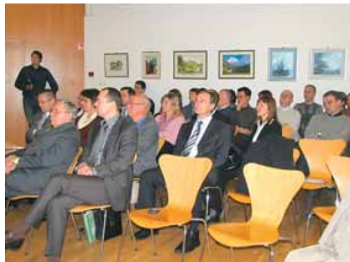
Del poslušalcev na akademskem večeru DAP v mali dvorani KC Janeza Trdine